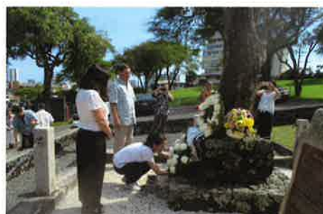
マキキ墓地で献花する参加者たち