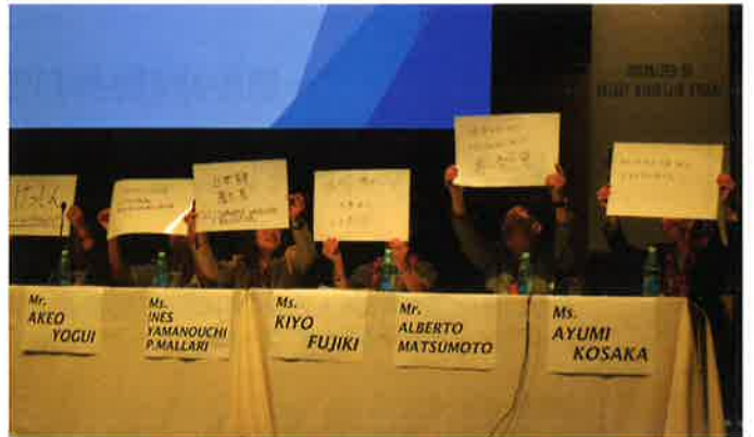
各パネリストが書いた「私にとっての日系レガシー」とは

い。今日は、それぞれの日系レガシーを日系に限らず世界の人々に伝える、そんなことを考えるよい機会になったことと思う」と締め括った。