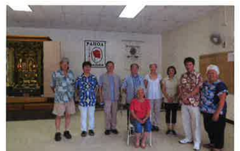
ハワイ島パホア日系人協会のみなさんと