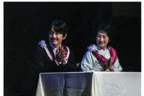
海外日系人大会、元年者150周年記念行事出席を主目的にハワイを公式訪問された秋篠宮同妃両殿下

リスティーン・クボタ 元年者150周年 実行委員会共同議長、三輪久雄共同議長、フジオ・マツダ元ハワイ大学総長などが参列した。