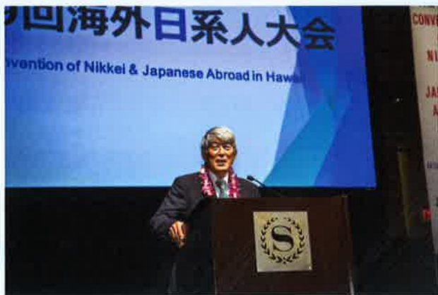
堀坂上智大学名誉教授

元年者が1868年、ハワイに向け横浜港を出発したのは、徳川幕府から新政府に江戸城が引き渡された「無血開城」からわずか2週間後のこと。正に激動の日本を後にし国外に向かった元年者は、日本人の海外移住の魁(さきがけ)となった。