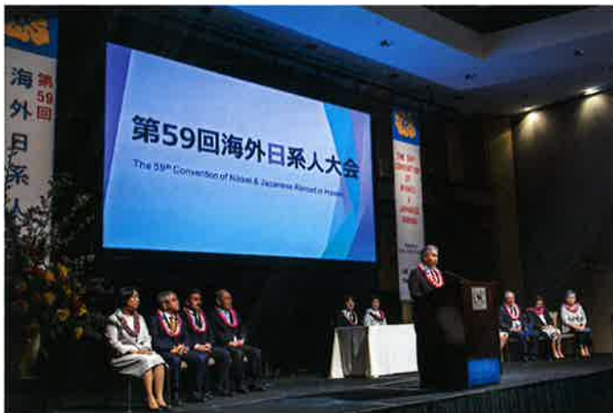
来賓挨拶を行なうデービッド・イゲ・ハワイ州知事

6日、第59回海外日系人大会は、「オリ」と呼ばれるハワイ先住民の祈りの儀式で幕を開けた。今大会には、15カ国より約300名が参加した。田中克之当協会理事長は、50年前に元年者100周年を祝ってハワイで開催した大会の参加国はわずか5カ国であったことに触れ、各国からハワイに集まった参加者をはじめ、関係各方面へ御礼の言葉を述べた。