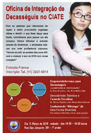
CIATEワークショップのチラシ