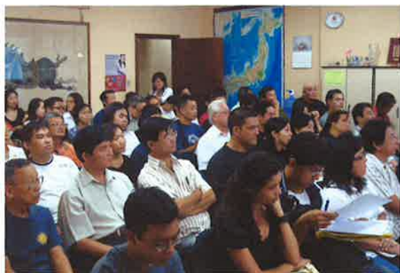
合同研修会に集まった人たち

今回の「NIKKEI NETWORK」ではよいご報告ができますように、一同頑張る所存です。