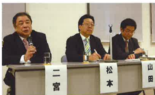
会場からの質問に答える講師陣 (JICA横浜で)