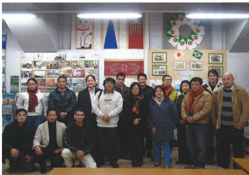
2010年1月23日、名古屋で行った第10回NNBJ会議に集まったメンバー (COLÉGIO BRASIL JAPÃOで)

我々は、日本社会に生きる日系人という不思議な状況を経験しています。海外で暮らす日系人の皆さんとなら変わらない問題を、本国である日本で我々は体験している。日本の日系人の暮らしが向上するだけではなく、海外に暮らす日系同胞の暮らしが向上する事を願っています。