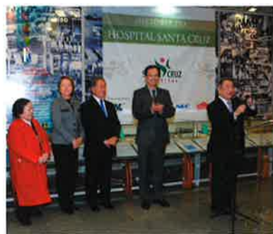
出版記念パーティで挨拶をする筆者(右)

今回のご訪伯で私は、サンパウロにあるサンタクルス病院をご訪問された両殿下に、同病院の歴史を説明させていただきました。サンタクルス病院は1940年に