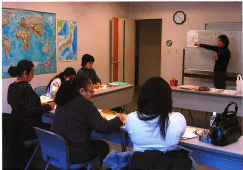
熱心に授業を受ける受講生たち。JICA横浜で

教室開講から5年間は、ほぼ毎期30名前後の受講者があり概ね盛況であったが、平成20年秋のリーマン・ショックが引き金となり、仕事を失って帰国する受講者が目立つようになった。平成23年には東日本大震災の影響もあったと見られ、受講者数は10名を切るようになってしまった。リーフレット、ウェブサイト、SNS等を利用して広報に努め、さらに関係者の口コミにも後押しされて一時的に人数が持ち直すこともあったが、受講者減少という大きな流れは