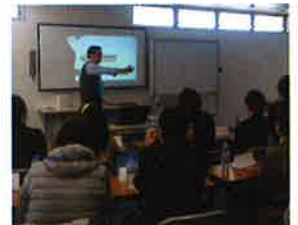
留学生セミナーで企業訪問する留学生たち

募集分野は医学、歯学、経済学、法学、情報学、農学、理工学、教育学等で、手当支給期間は2年間(医学および歯学の博士課程のみ4年間)。本事業は、JICAが行う移住者支援の一環として、アルゼンチン、ウルグアイ、コロンビア、チリ、ドミニカ共和国、パラグアイ、ブラジル、ベネズエラ、ペルー、ボリビア、メキシコの日系人を対象としているが、当該国出身で、日本に在住している日系人も応募できる。